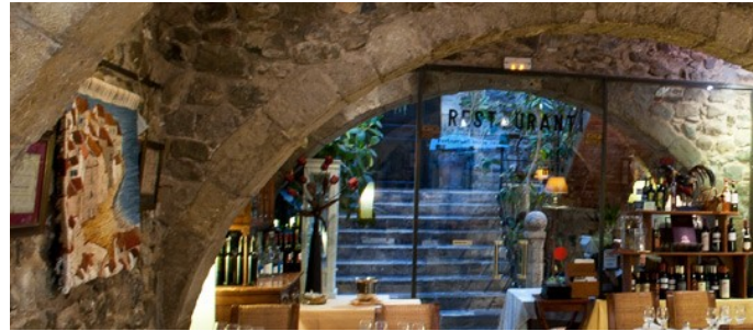
RESTAURANTE CURIA REIAL