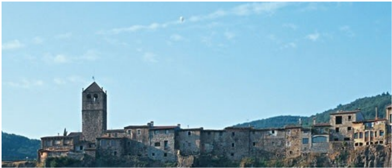
CASTELLFOLLIT DE LA ROCA

El pequeño pueblo de Castellfollit de la Roca se alza sobre un espectacular risco basáltico de 50 metros de altura y de casi un kilómetro de largura, recortado por el río Fluvià. Las estrechas callejuelas del pueblo desembocan en la antigua iglesia de Sant Salvador, en el extremo del risco, donde se halla un mirador con unas vistas privilegiadas.