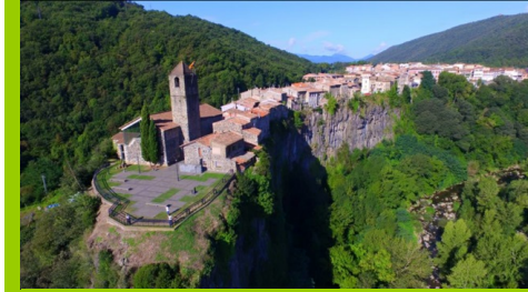
CASTELLFOLLIT DE LA ROCA