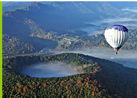
VOLCANES DE LA GARROTXA

Desplazamiento entre Santa Pau y los volcanes de la Garrotxa. Son 3 kilometros.