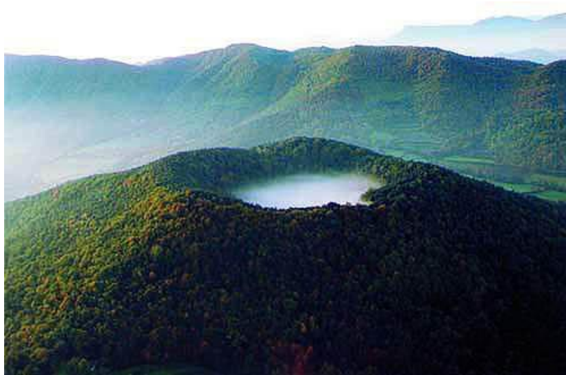
VOLCAN DE SANTA MARGARIDA