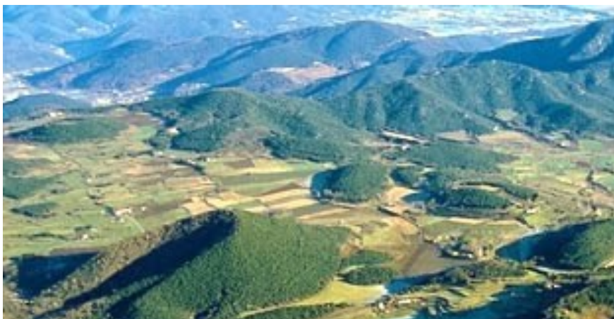
VOLCAN DE CROCAST