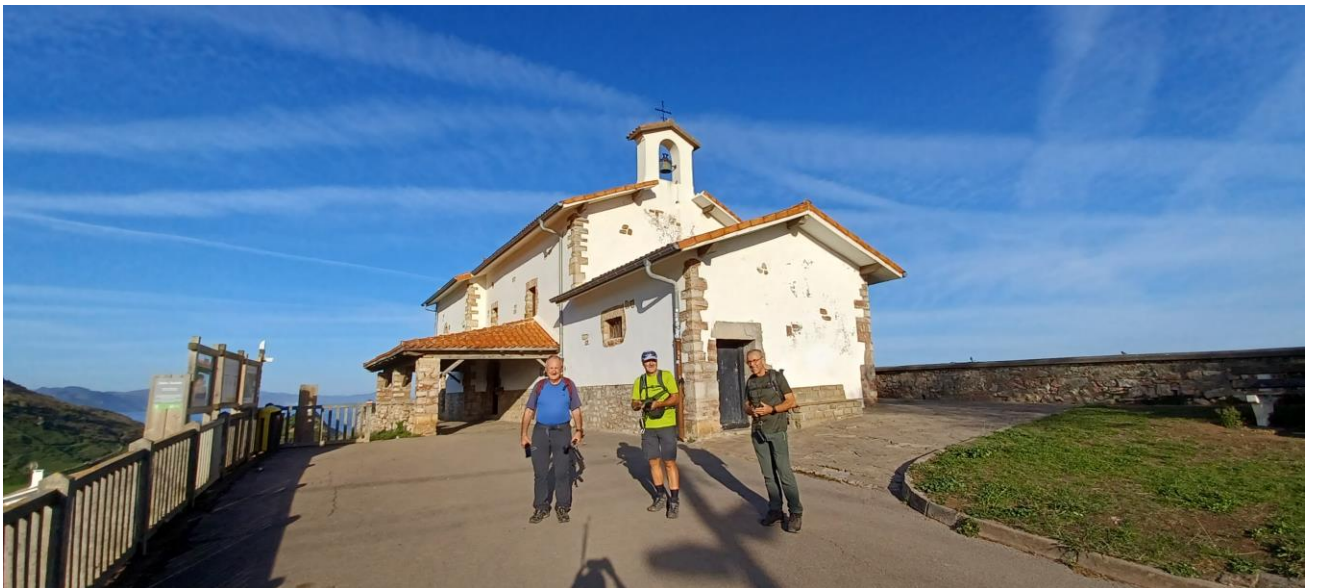
ERMITA SAN TELMO

Atravesaremos el núcleo de Elorriaga y posteriormente el Área Recreativa de Galarreta (un buen sitio para el hamaiketako) antes de proseguir camino de Zumaia y visitar la citada Punta Algori y la ermita de SAN TELMO.