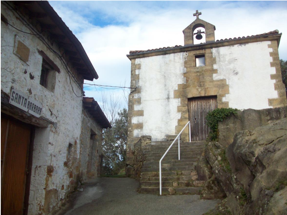
ERMITA SANTA BARBARA

Comienzan entonces la Ruta del Txakoli siendo testigo de ello las enormes fincas de viñedos. Por caminos de buen piso llegaran al Alto de Garate (carretera que une Getaria con la Autopista de Donosti).