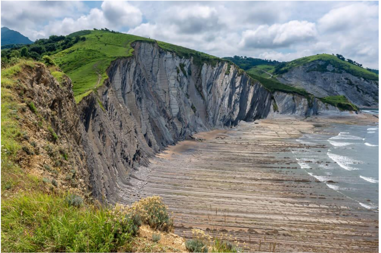
PLAYA DE SAKONETA

Atravesaremos el núcleo de Elorriaga y posteriormente el Área Recreativa de Galarreta (un buen sitio para el hamaiketako) antes de proseguir camino de Zumaia y visitar la citada Punta Algori y la ermita de SAN TELMO.