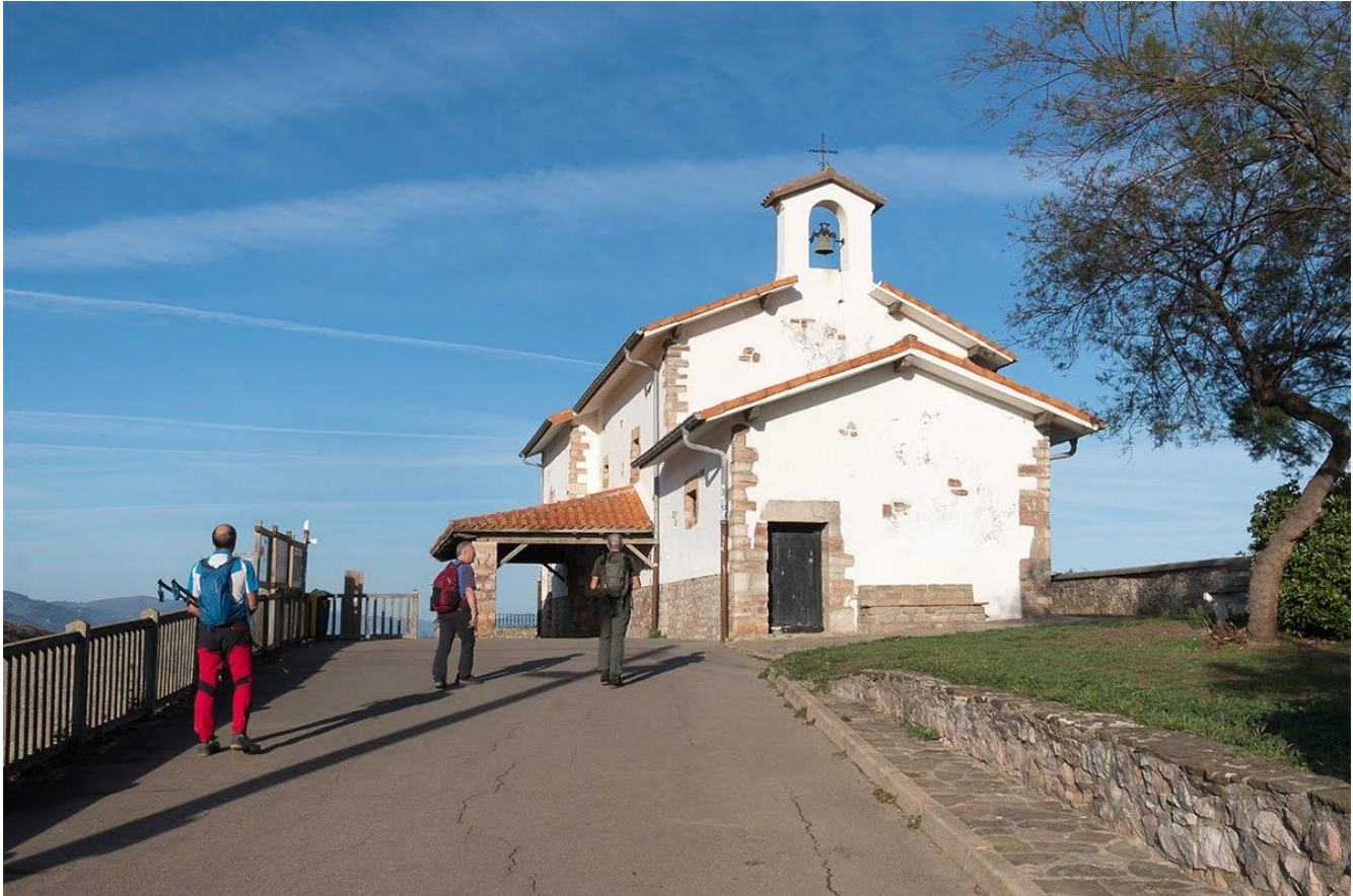
ERMITA SAN TELMO

A través de un paseo urbano llegarán a la Ermita de San Telmo, capilla renacentista sobre la playa de Itzurun, (que también posee unos bonitos Flysch) y que se hizo famosa por la película de "Ocho apellidos vascos".