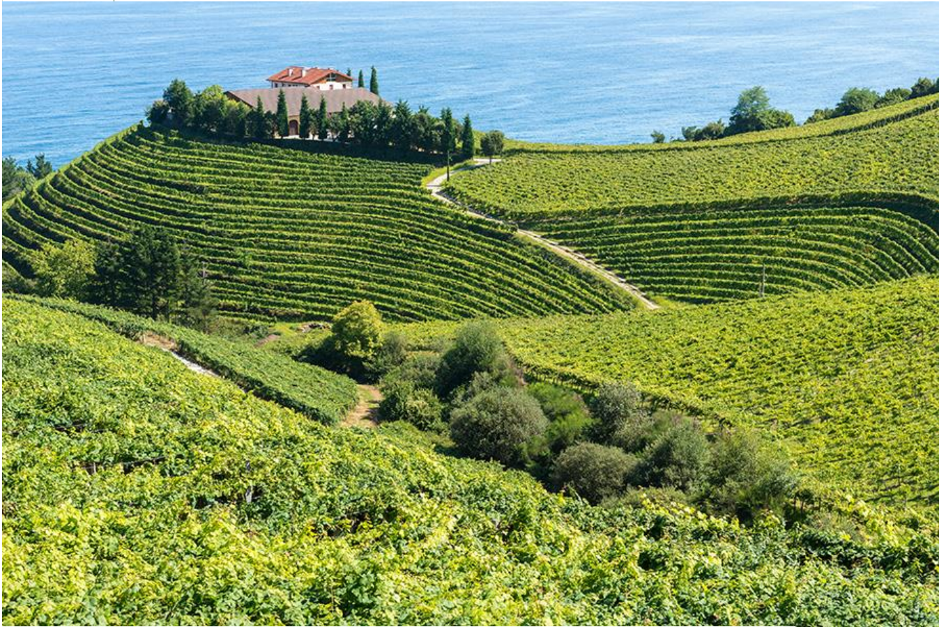
RUTA DEL TXAKOLI

Por momentos las vistas de la costa son impresionantes incrementándose más aun en la bajada final a Zumaia.