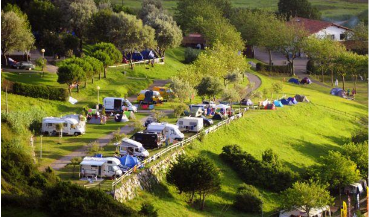
CAMPING DE ZARAUZ

Esta alternativa sale del Camping de Zarauz bajando por el acantilado con preciosas vistas llegando al campo de golf y a la playa por unas pasarelas de madera.