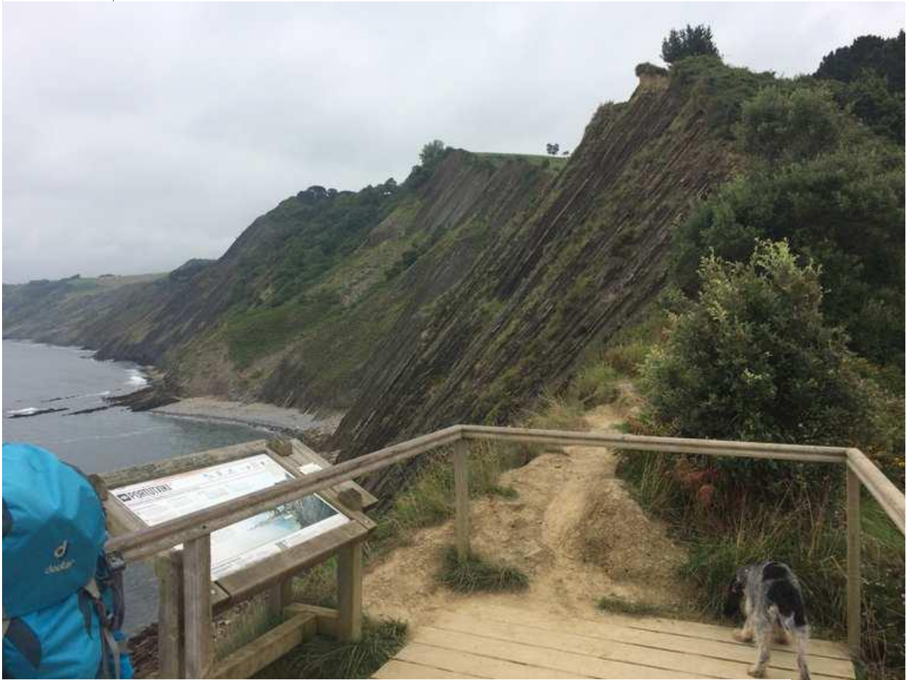
MIRADOR DE PORTUTXIKI

Uno de los puntos más bellos es la playa de SAKONETA , donde en marea baja merece la pena caminar entre los flysch, siendo normal ver a la gente sentada disfrutando del lugar.