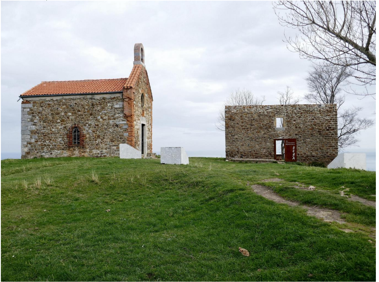
ERMITA SANTA CATALINA

Estarán en el epicentro de del denominado GEOPARQUE o línea de acantilados indomables que van desde Zumaia a Mutriku pasando por Deba. También se considera Geoparque la zona interior de montaña como ese rincón espectacular llamado LASTUR, ya visitado por nosotros en otra ocasión.