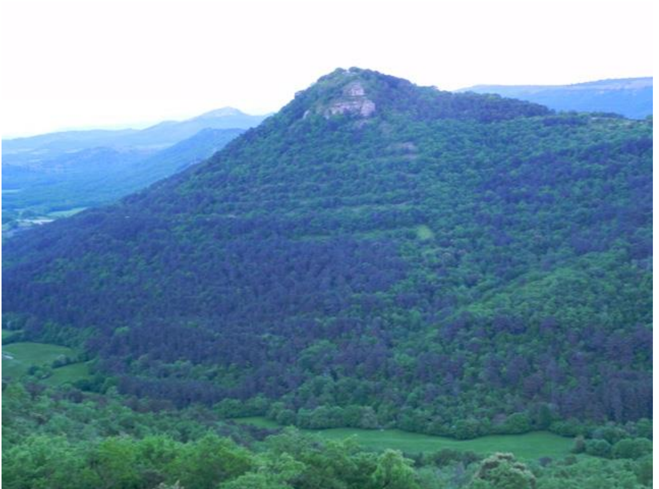
ALTO DEL CASTILLO DESDE EL BARRANCO LAS FUENTES

Vamos a seguir los pasos de la senderista hasta la última casa del pueblo donde giraremos a la izda. y comenzaremos una subida al monte El Castillo (840 m).