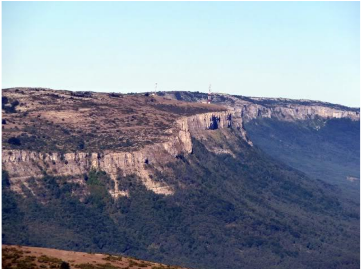
SIERRA DE BADAIA