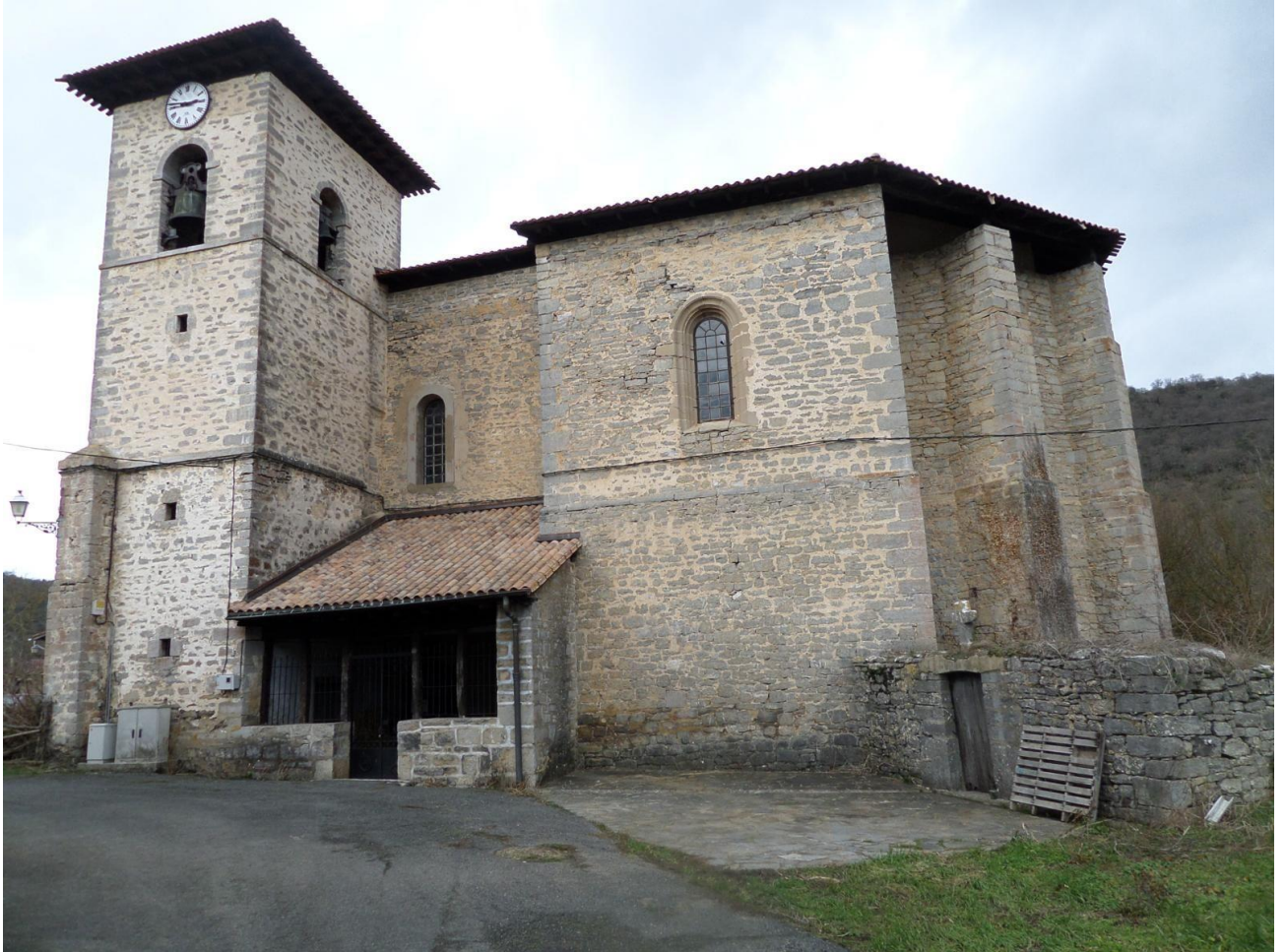
IGLESIA LA ASUNCIÓN EN ANDAGOYA

Esta alternativa sale también desde Andagoya, pero giraran a la derecha de la población por la iglesia de la Asunción, paralelos al rio Vadillo hasta adentrarse en un gran hayedo, hasta el collado de las Carboneras.