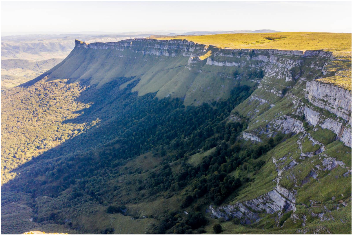
SIERRA DE ARKAMO