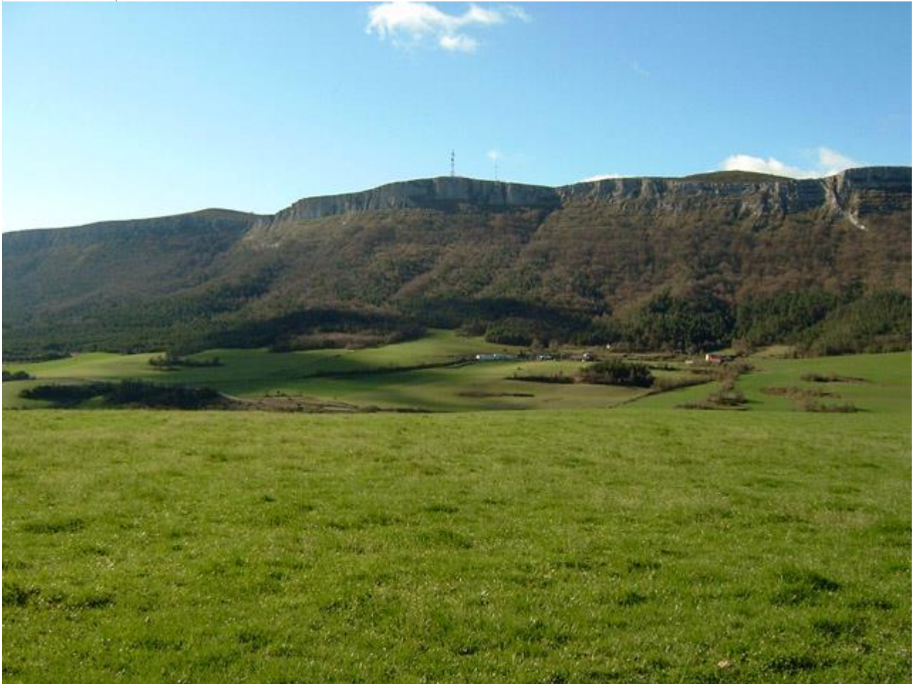
MONTEMAYOR (SIERRA DE ARKAMO)

Pasaremos por la ermita de San Antonio (amaiketako) y llegaremos fácilmente al Tellea.