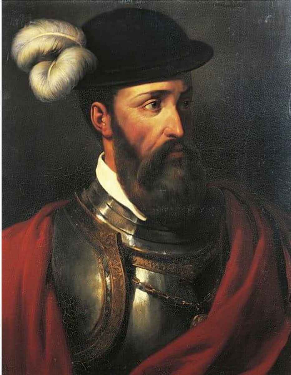
PASCUAL DE ANDAGOYA

La sierra de Gibijo que se extiende entre las sierras de Arkamo y Badaia.