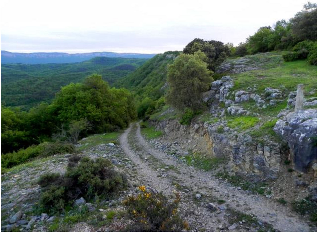
PORTILLO DE ATAGUREN