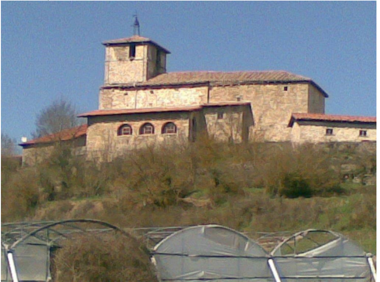
IGLESIA DE SENDADIANO