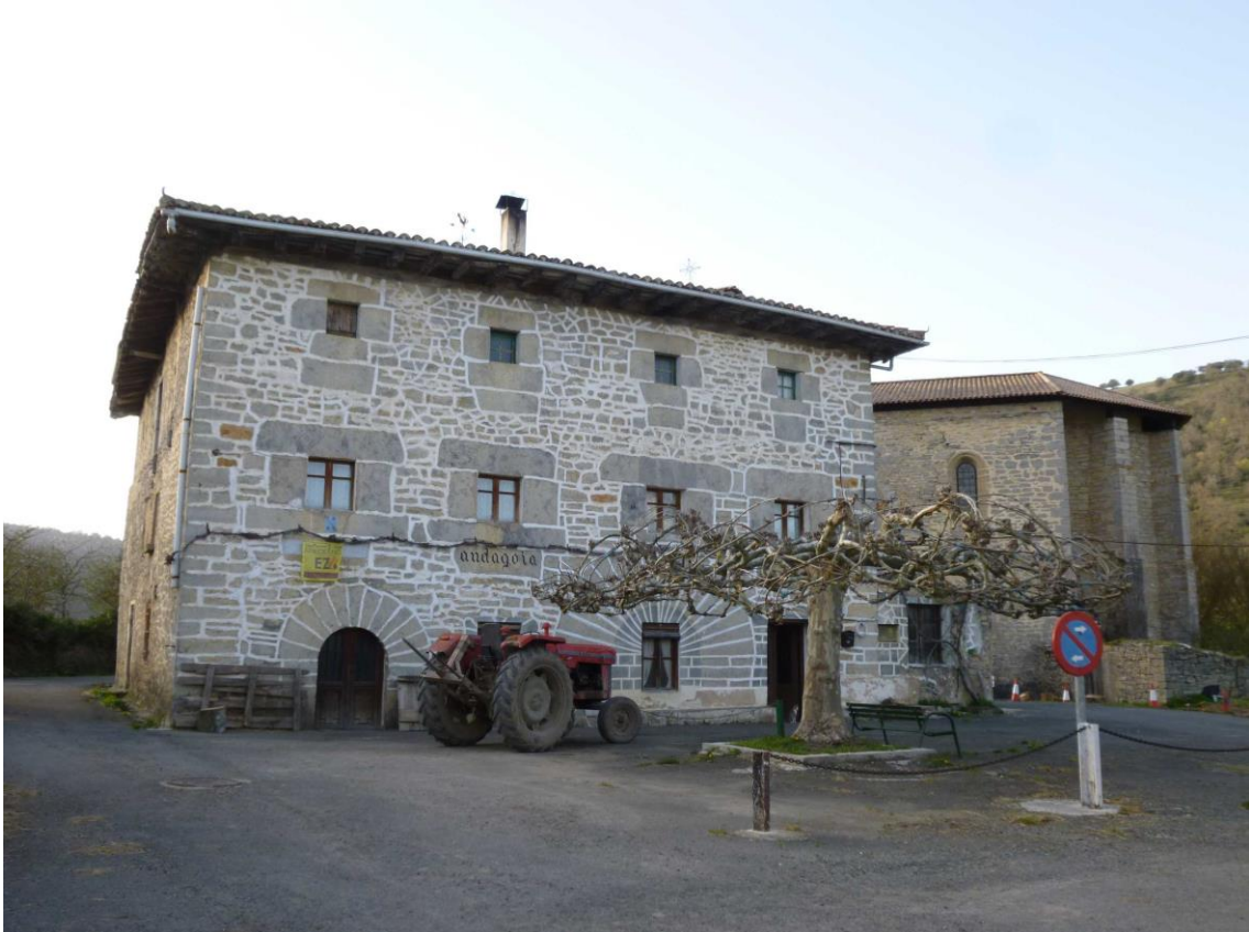
CASA TORRE EN ANDAGOYA

Esta alternativa saldrá desde Andagoya en dirección al barranco de Las Fuentes (en realidad igual que el resto tendremos que bajar del autobús unos cientos de metros antes ya que el túnel de acceso al pueblo no permite el paso del bus).